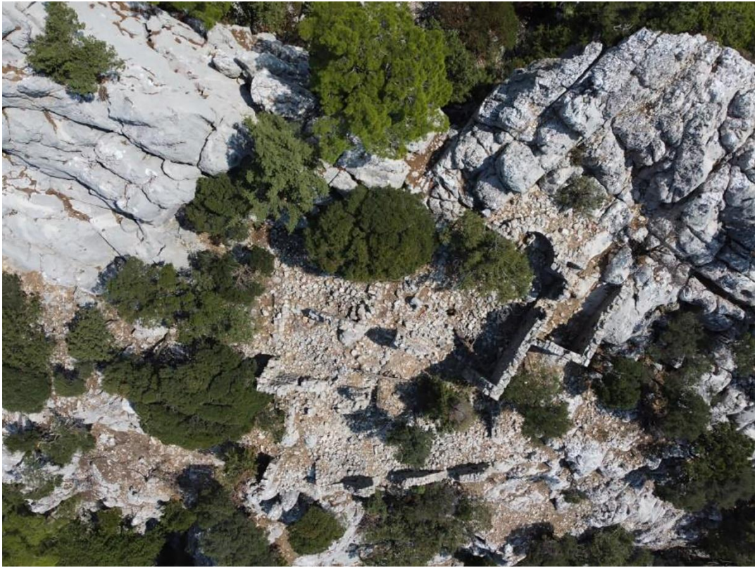
Resim 14: Güney Kilise havadan görünüm