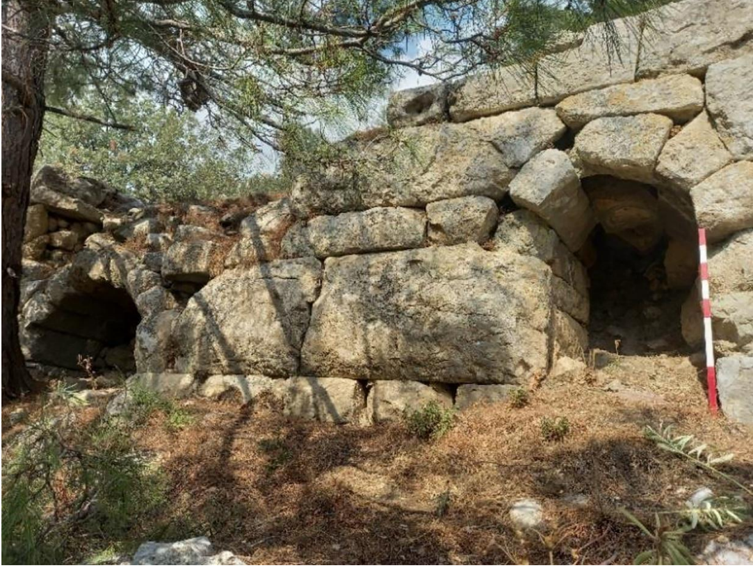
Resim 13: Tonoğlu Teras