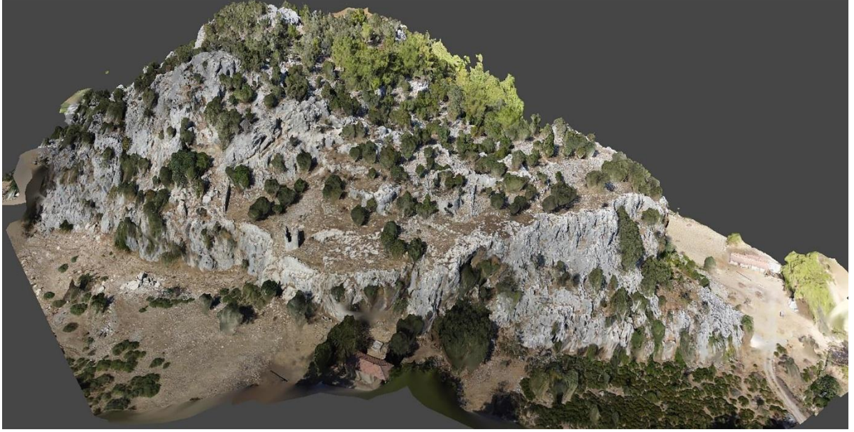
Resim 1: Asar Tepe Kale Yerleşimi, ortofoto ve 3D modelleme doğudan görünüm