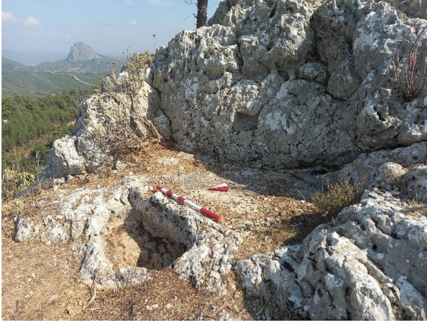
Resim 9: Zeytinyağı İşlik Alanı