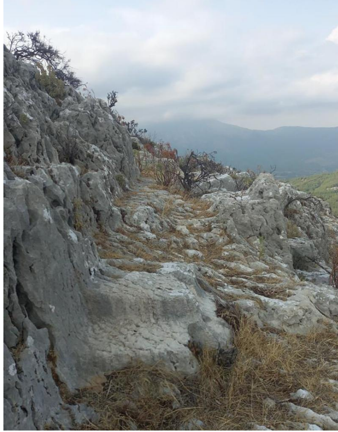
Resim 7: Kireçtaşı kayalara oyulmuş merdivenler