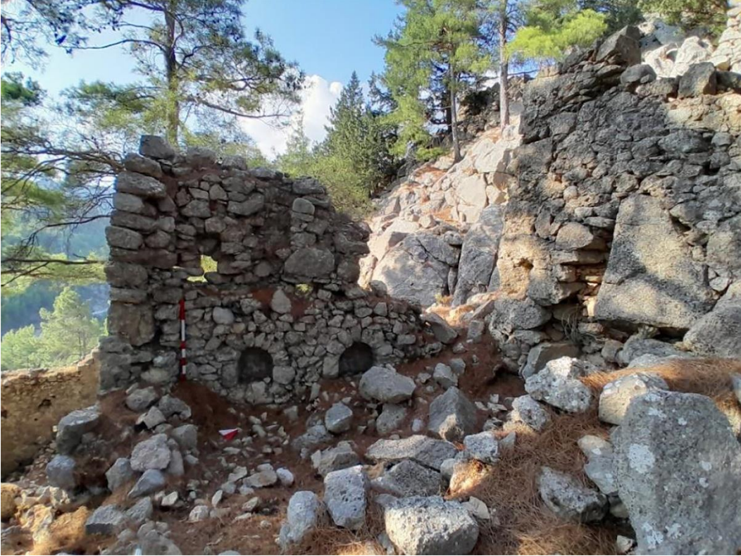
Resim 12: 3. Teras / Yapı 1 / Mekan 3