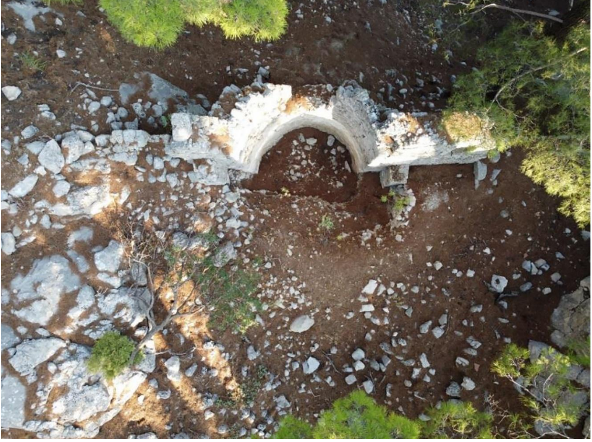
Resim 11: Burgaz Kale Yerleşimi, havadan görünüm