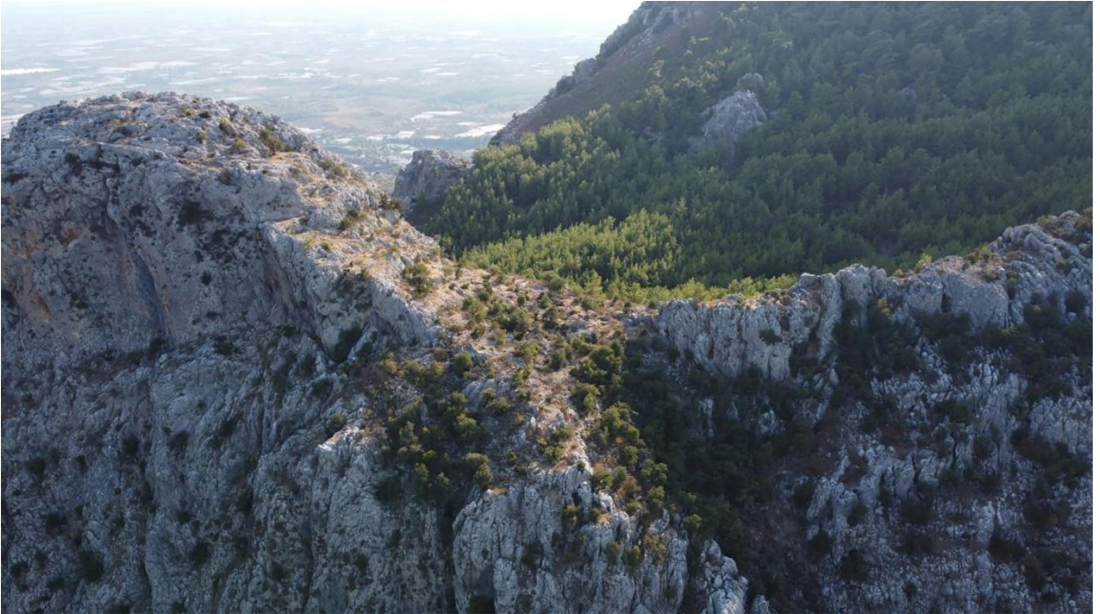
Resim 6: Kanlıkaya Tepe Yerleşimi, kuzeyden görünüm