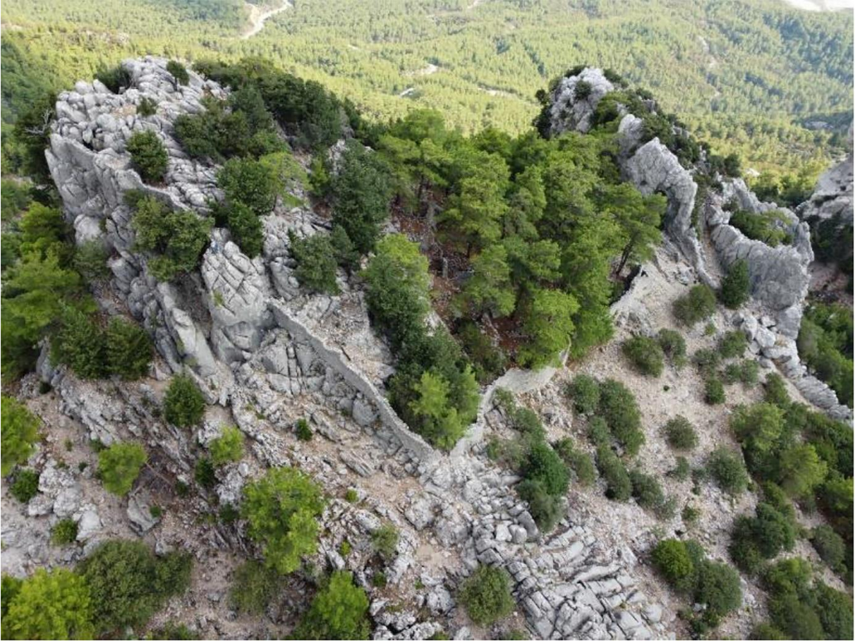
Resim 10: Burgaz Kale Yerleşimi havadan görünüm