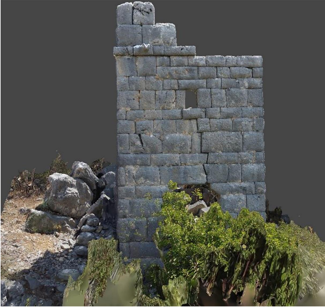
Resim 2: Batı Kule, ortofoto ve 3D modelleme görünümü