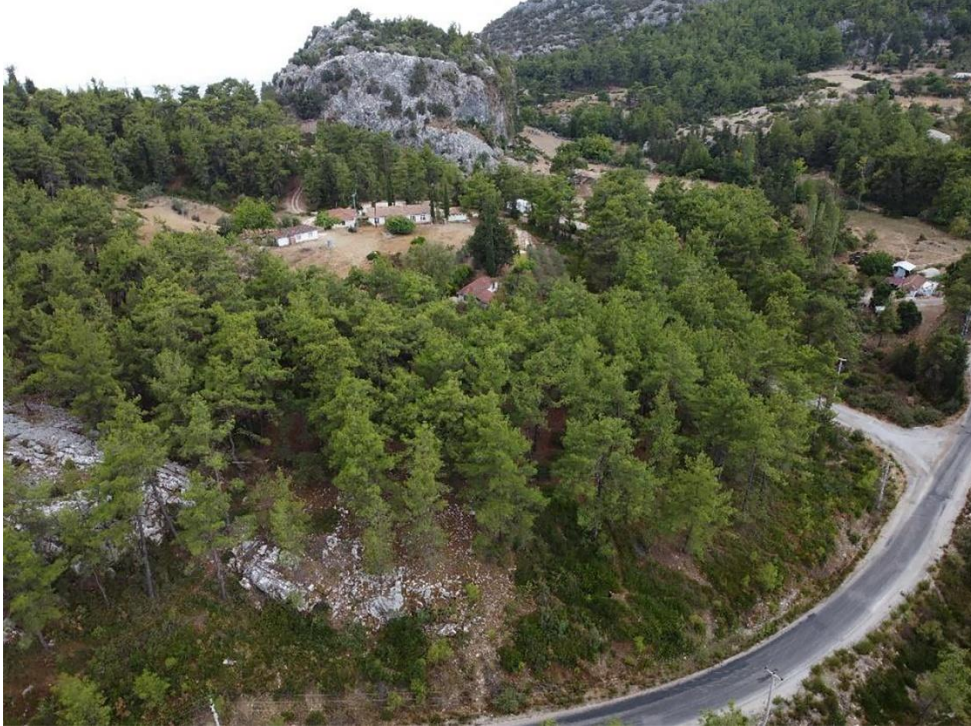
Resim 4: Asar Tepe, Doğu iftlik Yerleşimi havadan görünüm