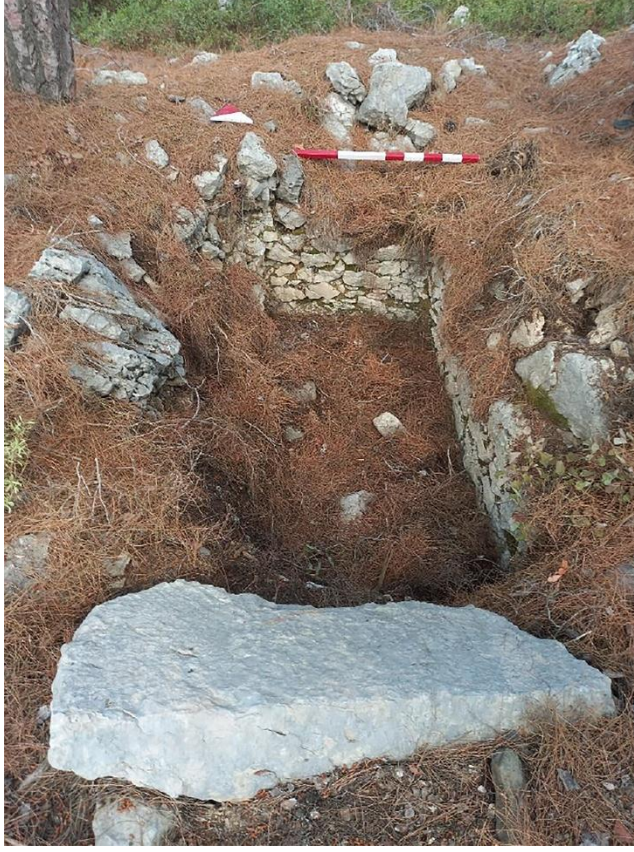
Resim 5: Asar Tepe, Doğu iftlik Yerleşimi, Sandık Tipi Mezar