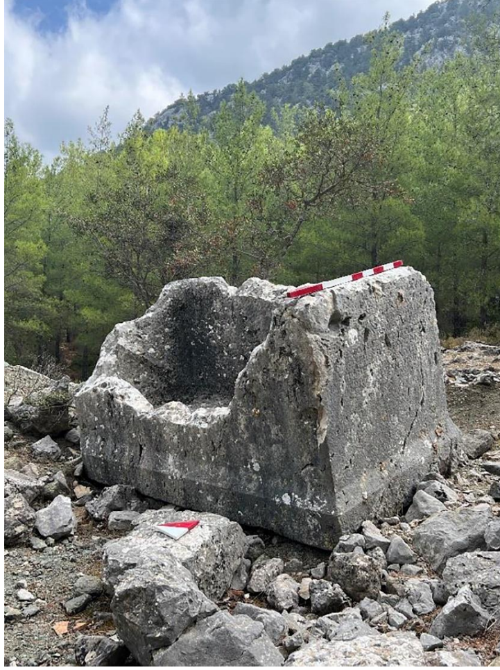
Resim 3: Mezarlık Mevkii, lahit teknesi