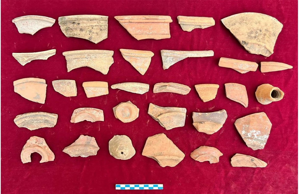
Resim 8: Servis Kaplarıyla İlişkili Kırmızı Astarlı Seramikler (DSD-MS 1.-3. yy)